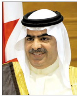
الشيخ فواز بن محمد آل خليفة

وأوضح الشيخ فواز أن نحو 61 مواطناً بحرينياً من مجموع المواطنين في بريطانيا، لا يزالون في المملكة المتحدة، فقد عاد منهم إلى البحرين 52 مواطناً ولم يبق منهم حالياً سوى 8 مواطنين لطرف مختلفة. فيما كان هناك 66 بحرينياً يقيمون ويعملون في المملكة المتحدة قد عاد