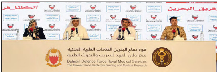
جانب من المؤتمر الصحفي للفريق الوطني لمواجهة «كورونا»

60 ألف مستخدم لتطبيق «مجتمع وإع» منذ تشييده المانع: الكثير من المستلزمات الطبية يتم توفيرها من قبل السعودية السلامان: 18% من المصابين يخضعون للعلاج وفق البروتوكول المتبع القحطاني: الاختبارات البحرية تستوعب إجراء 2000 فحص يوميا