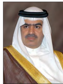
الشيخ فوز بن محمد

أكد سفير مملكة البحرين لدى المملكة المتحدة الشيخ فوز بن محمد آل خليفة، في تصريح له «الأيام»، أن نحو 1011 مواطناً بحرينياً كانوا موجودين في المملكة المتحدة، لم يتبق منهم الآن سوى 176 مواطناً موزعين ما بين طلبة وزائرين ومقيمين بغرض العمل، وموظفي السفارة، وذلك بعد أن تم تأمين عودة 835 مواطناً.