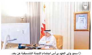
○ سمو ولي العهد يراس اجتماع اللجنة التنسيقية عن بعد.