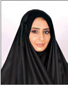
سمو الشيخة زين بنت خالد

أعلنت مؤسسة البرة الخليفة استعدادها لتفقد مبادرة «جسر»، وهي مبادرة نوعية والأولى من نوعها في مملكة البحرين، وهي عبارة عن «منصة العمل عن بُعد والعمل الموقت». وتوفر هذه المنصة الفرصة والمكان للمواهب البحرينية لعرض مواهبها ومشاريعها، ما يساعد أرباب العمل على إيجاد الأشخاص المناسبين للقيام بالأعمال التي لا تتطلب التزاماً دائماً، حيث تم توقيع مذكرة تفاهم مع شركة «فانجار» لتنفيذ المشروع، ويأتي هذا المشروع ضمن سياق مساعيها الهادفة لتعزيز شراكتها المجتمعية، ومن منطلق رسالتها لتكثيف الشباب وتنمية مهاراتهم العلمية والعملية: من أجل تحقيق رؤية المملكة الاقتصادية لعام 2030.