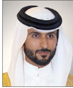
سمو الشيخ ناصر بن حمد

فقاته، وهو الأمر الذي نسعى إلى تحقيقه من خلال المؤسسة الملكية للأعمال الإنسانية. وأوضح سموه أن المؤسسة الملكية للأعمال الإنسانية تحرص وضمن عملها اليومي على متابعة أبنائها والاهتمام بهم وبصحتهم وتعليمهم وتوفير كافة أشكال الرعاية والخدمات التي تسهم في تطورهم وصقل شخصياتهم إلى جانب توفير الحياة الكريمة