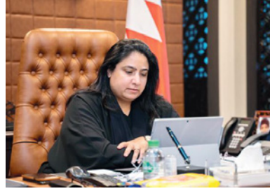
التفويض والنجاح. كما تم خلال الاجتماع مناقشة عدد من الموضوعات والقضايا ذات الاهتمام المشترك.

التنسيق مع الجهات الرسمية والبعثات الدبلوماسية