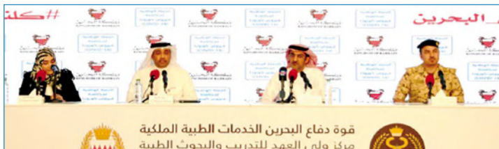
قوة دفاع البحرين الخدمات الطبية الملكية مركز ولي العهد للتدريب والبحوث الطبية