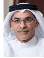
○ أسامة الخصاف، الأمين العام للشورى.

أكد المستشار أسامة أحمد الخصاف الأمين العام لمجلس الشورى استخدام التقنيات عن بعد، وتحقيق الكفاءة ذاتي للمجلس من خلال الاستعانة بالكوادر العاملة بأمانة العامة لتحقيق هذه الغاية. وفيما أعرب عن فخره واعتزازه بالجهود التي يبذلها منسبو الأمانة العامة لمجلس الشورى، لفت إلى الاستعدادات التي وفرها المجلس على مدى الأعوام السابقة، وساعدت في التحول للعمل عن بعد بكل يسر ومرونة، فيما قدم منسبو الأمانة العامة نموذجاً ناجحاً يستحق الاستناد والتقدير من خلال