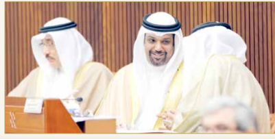
وزير المالية والقطاع الوطني في حديث خاص بجلسة مجلس النواب أمس

البلاد | مروة خميس قال وزير المالية والاقتصاد الوطني الشيخ سلمان بن خليفة آل خليفة إن الحزمة المالية للتصدي لفيروس كورونا البالغة نحو 4.3 مليار دينار تمثل ثلث حجم اقتصاد البحرين، وستغطي رواتب عدد كبير من المواطنين بحدود 100 ألف مواطن، علماً أن جميع المبادرات فيها فائدة للمواطنين، وستستمر في تنفيذها. (07)