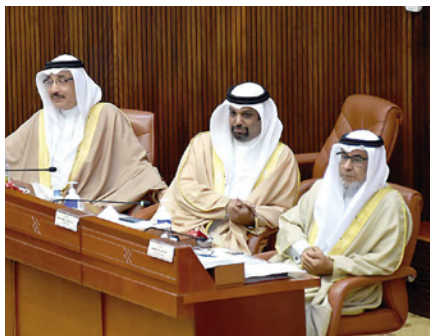
وزير الجسدين ووزيرا المالية والعمل خلال جلسة النواب أمس