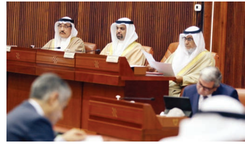
○ وزراء المالية والعمل والمجلسين خلال جلسة مجلس النواب.

كتب وليد دياب: وافق مجلس النواب خلال جلسته أمس برئاسة رئيسة المجلس فوزية زميل، بإجماع الحضور ٢٨٨ نائبا، على المشروع بمقتضى بشأن دفع ورواتب الموظفين البحرينيين في القطاع الخاص أشهر أبريل ومايو ويونيو القادمة من صندوق التأمين ضد التعتل بمبلغ ٢١٥ مليون دينار، وأحيل المشروع بقانون إلى مجلس الشورى. وأكد وزير المالية والاقتصاد الوطني الشيخ سلمان بن خليفة آل خليفة أن دفع الرواتب هو للبحرانيين فقط، نائفا ما يقال عن تحمل ورواتب الأجانب، مشيرا إلى أن الحكومة تتعامل بكل وضوح وشفافية مع الأمر، كما أنها مع مشاركة القطاع الخاص والعديد من الشركات في وضع الحلول خلال تلك الأزمة، لافتا إلى أنه سيتم إعلان تلك المشاركات لاحقا. وأعتبر أن الشركات المتوسطة والصغيرة والمتناهية الصغر من الفئات المهمة جدا في الاقتصاد