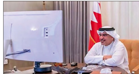
ولي العهد خلال ترؤسه اللجنة التنسيقية