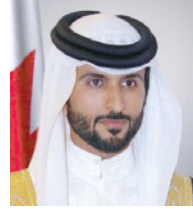
سمو الشيخ ناصر بن حمد آل خليفة

رئيس الوزراء، ومؤازرة صاحب السمو الملكي الأمير سلمان بن حمد آل خليفة ولي العهد الأمين نائب القائد الأعلى النائب الأول لرئيس مجلس الوزراء. جاء ذلك بمناسبة ذكرى يوم اليتيم العربي الذي يصادف