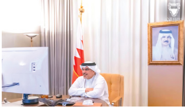
ترأس صاحب السمو الملكي الأمير سلمان بن حمد آل خليفة ولي العهد نائب القائد الأعلى النائب الأول لرئيس مجلس الوزراء اجتماع اللجنة التنسيقية والذي عقد عن بعد، وخصص لبحث آخر مستجدات التعامل مع فيروس كورونا (كوفيد 19).